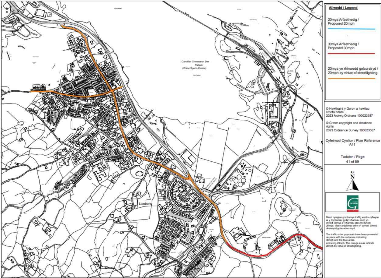
Llanberis - Pentre Castell